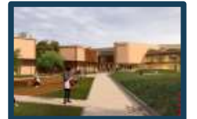
Nuovo Istituto Meucci - Galilei