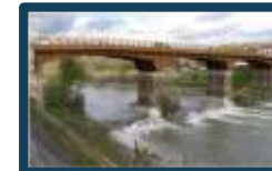
Adeguamento Ponte sulla SP106 Km 7+145