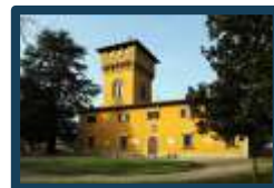
Riqualificazione Villa Pecori Giraldo Borgo San Lorenzo