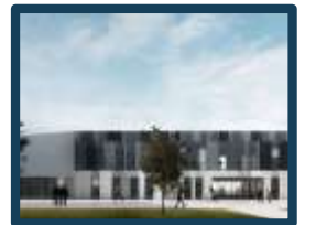
Nuovo Edificio San Salvi