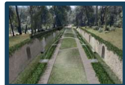
Viale degli Zampilli - Pratolino