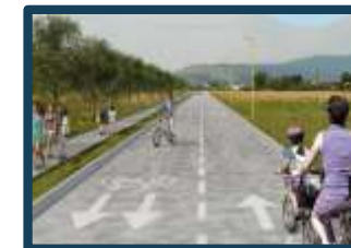
Pista ciclabile Firenze - Prato