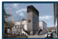
Centro Civico ex casa del fascio Barberino