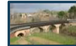
Adeguamento Ponte SP64 Km 7+700