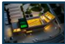
Teatro Comunale Empoli