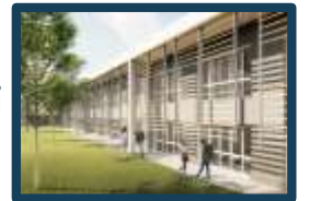
Nuovo Edificio Scolastico Empoli