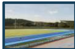
Riqualificazione impianti sportivi Dicomano