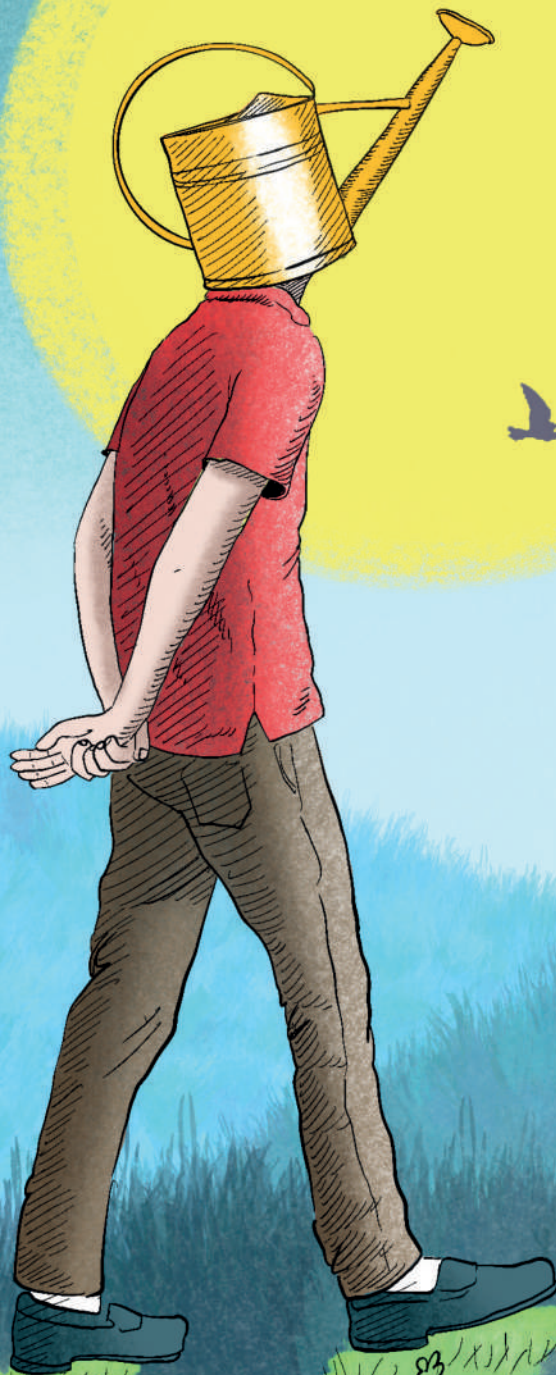
Illustrazione di Mariagrazia Colace

teatro musica danza circo incontri La pazienza del coltivare